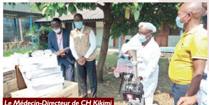
Le Médecin-Directeur de CH Kikimi recevant les équipements du Sec. Exécutif de Caritas Congo Asbl