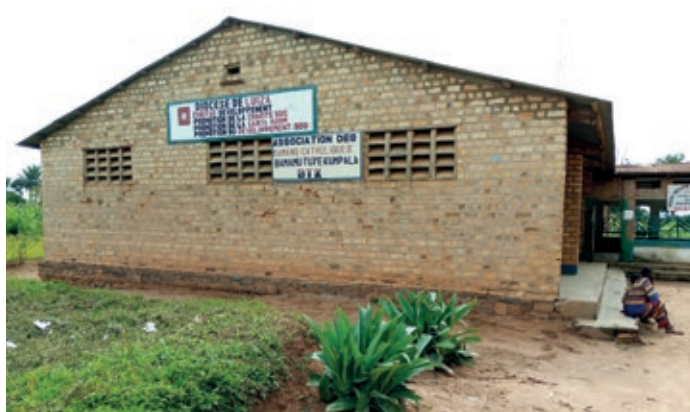
Bureau de la Caritas-Développement Luiza