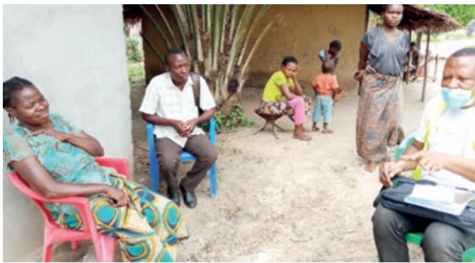
Un RECO en visite à domicile dans la ZS de Mbandaka