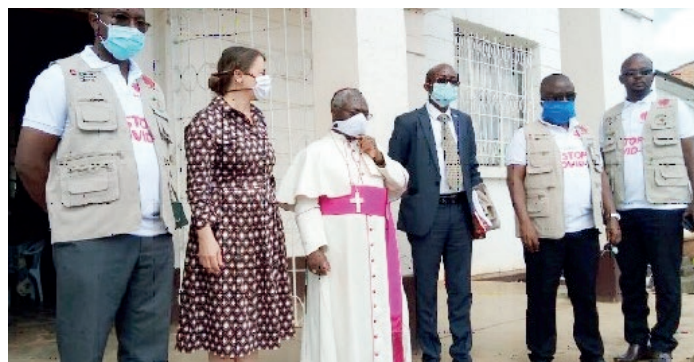
Lancement du projet par l'Archevêque de Bukavu et la Directrice de la Coopération Suisse

Financé par la Coopération Suisse., ce projet a ciblé 33 Zones de Santé de la Province du Sud-Kivu. Diocèse de Bukavu. Il a une durée de 6 mois, avec une extension sans coût de 3 mois, qui a permis la réhabilitation du bureau incendié du BDOM Bukavu. Il appuyera financièrement l'organisation, en janvier 2021, d'un atelier national