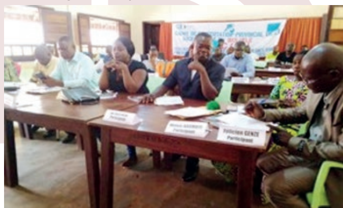
Atelier de Buta CCPSC/ Bas-Uélé à Buta

Un atelier de validation des outils de gouvernances produits par un groupes d'experts, analysés par les différents CCPSC lors des AG en province et débattu au 2ème forum national de la Société civile au Pullman, a été adopté début novembre de cette année de ces cadres organisé en provinces,.