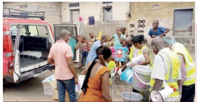
Réception des matériels PCI par une FOSA

Sanitaires couvrant une population totale estimée à 55.441 habitants de la périphérie de la ville de Kinshasa. Il s'agit de l'Hôpital Général Roi Beaudouin 1 er , des Centres Hospitaliers Kinkenda et Lisungi, ainsi que du Centre Médical CELPA/Ngaliema et le Centre de santé « Le Bon Berger ». Toutes étant des formations sanitaires