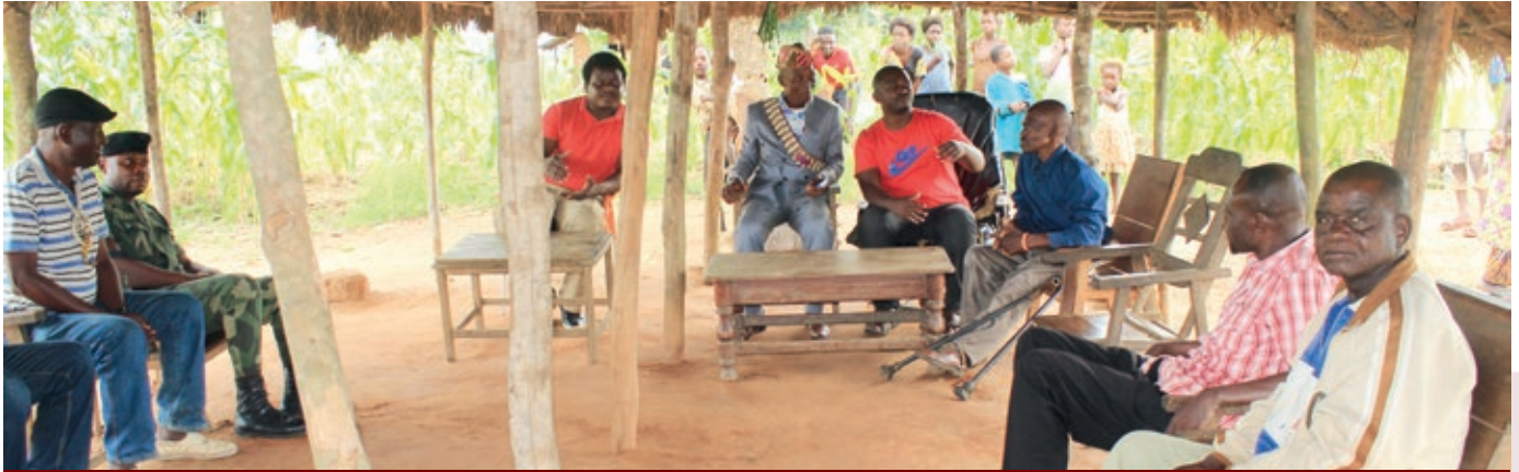
Echange d'informations avec les leaders communautaires sur l'élaboration et la validation des microprojets en faveur des Communautés Dépendantes de la Forêt, à financer par le projet PACDF. Ici, 1ère rencontre de deux délégués de Caritas Congo Asbl (autour du Chef) avec le chef de groupement de Tshintu Mwanza, Territoire de Lupatapata, Province du Kasai Oriental

sur le document de la politique nationale de l'aménagement du territoire avant-projet de loi relative à l'aménagement du territoire en RDC