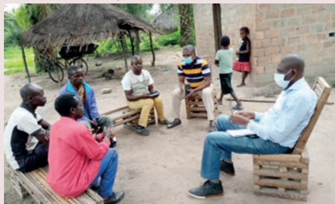
Visite du Coordonnateur National du SPS (accompagné du Data Manager et le coordonnateur Provincial SBC/Haut Lomami) d'un Tradi-praticien dans l'Aire de Santé de Lukamvwe, Zone de Santé de Songa, pour évaluer son implication dans la surveillance à base communautaire des cas de PFA

* Au second semestre jusqu'au mois d'octobre, 67 cas suspects de PFA ont été notifié dont 63 par la communauté soit une proportion de 94%. Aussi 88 cas suspects de Rougeole, 4 cas suspects de fièvre jaune et 3 cas suspect de tétanos néonatal.