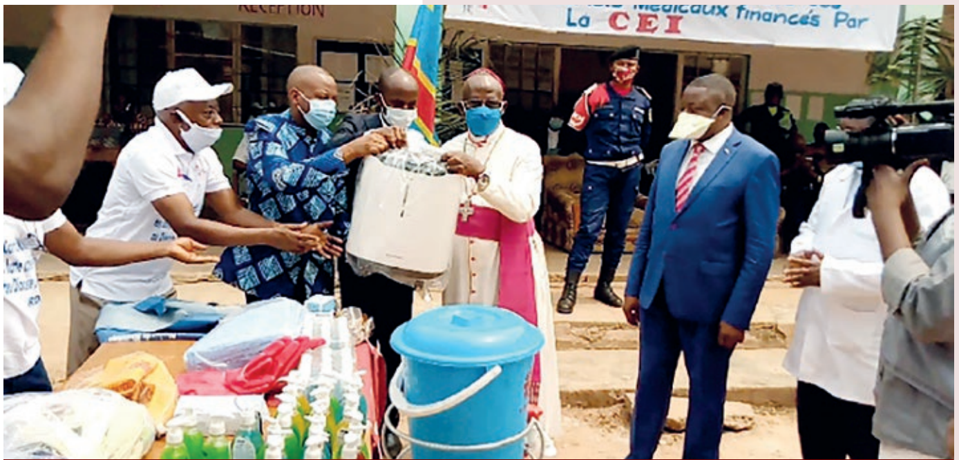
Le Staff de la Caritas-Développement Mbuji-Mayi aux côtés de l'Evêque Ordinaire du lieu dans la contribution à la riposte contre la Covid19 dans la Province du Kasai Oriental

Pour accomplir sa mission, le Réseau Caritas Congo Asbl possède de biens nombreux (bureaux, meubles, centres d'accueil, fermes agricoles, charroi automobile, mini-barrages, usines et équipements divers), même dans les coins les plus reculés du pays.