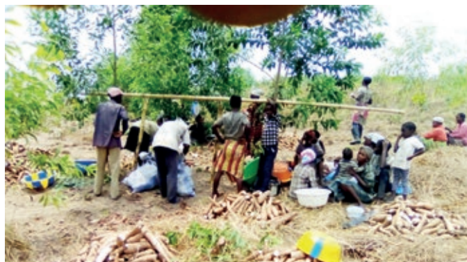
Récolte et distribution des tubercules de manioc du champ communautaire du CVD MVONDO/AXE KINSIONA-KASANGULU