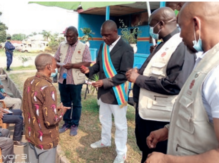
Le Bourgmestre de Ndjili remettant une carte Sim avec monnaie électronique aux ménages vulnérables affectés par la Covid-19

Caritas Congo ASBL a été parmi les premières Caritas à bénéficier de ce financement, fruit des efforts conjoints