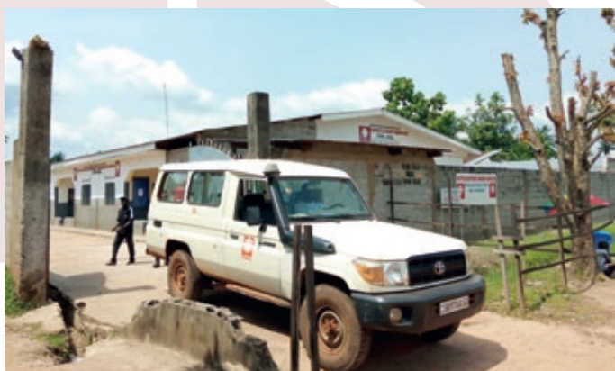
Bureau de la Caritas-Développement Mbandaka-Bikoro

Contribuer à la consolidation de la bonne gouvernance et de la transparence dans la gestion des affaires publiques (implication du Réseau Caritas dans la mise en œuvre et le suivi des ODD (Agenda 2023) en rapport avec les engagements du Gouvernement congolais; Formation des animateurs de la Société Civile et des élus locaux au contrôle citoyen de l'action publique; publication, à travers les médias, des rapports de contrôle citoyen de l'action publique; etc);