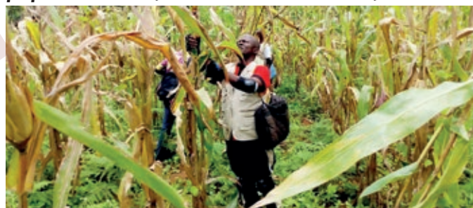
Le Superviseur du projet à Luiza dans un champ de maïs

C'est depuis 3 ans que Caritas Congo et Caritas Allemagne interviennent dans la Province du Kasai, plus précisément dans le Diocèse de Luiza pour soutenir la réinsertion socio-économique des personnes qui avaient été déplacées par la crise du Kasai des années 2016-2017. L'action cible également les personnes retournées et celles qui ont été rapatriées de force par le Gouvernement de l'Angola. Afin de consolider l'harmonie entre les personnes venues et la population-hôte, cette dernière bénéficie également de l'aide qui consiste en vivres, articles ménagers essentiels et en intrants agricoles (semences et outillage) par l'approche de distribution directe. Dans sa phase actuelle qui est prévue pour s'étendre du 1er Juin 2020 au 28 février 2022 et qui cible 3350 personnes, le projet prévoit également l'aménagement des sources d'eau potable.