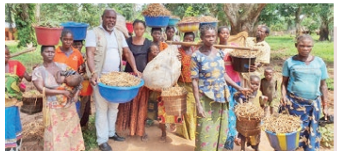
Bénéficiaires venant du champ, site de Kandakanda

« Dieu merci, à notre retour, Caritas est venue à notre secours. Caritas Congo nous a assistés en nous en apportant l'aide humanitaire composée des vivres, matériels aratoires et semences. Pour l'instant, nous avons récolté le niébé et attendons la récolte du maïs dans les tous prochains jours. Ma satisfaction est que