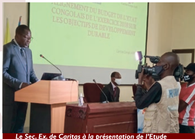
Le Sec. Ex. de Caritas à la présentation de l'Etude

Les Nations Unies recommandent le partenariat public-privé incluant la Société Civile dans la mise en œuvre des Objectifs de Développement Durable (ODD). Membre co-fondateur du Collectif pour les Objectifs de Développement Durable, agenda 2030 (C0DD2030), Caritas Congo ASBL a présenté en décembre 2020, son rapport de l'analyse de l'alignement du budget 2018 du gouvernement de la RD.Congo sur les ODD et y a proposé des stratégies ad hoc pour une prise en compte optimale des ODD dans les plans d'action et les budgets de l'Etat. Cette étude avait bénéficié de l'appui du PNUD-RDC.