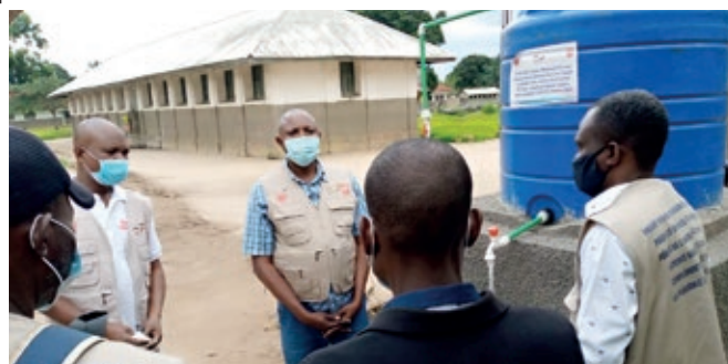
Le Chargé de Suivi de la Caritas remettant un point d'eau pour HGR Idiofa devant MCZ et Equipe-cadre de la ZS Idiofa

Financé par le Ministère allemand des Affaires Etrangères, à travers la Caritas Allemagne, ce projet a une durée de 6 mois, depuis septembre 2020. Il couvre les 5 Zones de Santé du Territoire d'Idiofa (Idiofa, Ipamu, Kimputu, Koshibanda et Mokala), dans le Diocèse d'Idiofa. Les bénéficiaires sont constitués de façon générale par toute la population des 5 ZS ciblées (1.295.790 habitants), et spécifiquement par le Personnel médical et les agents communautaires impliqués dans la surveillance et la prévention de COVID-19.