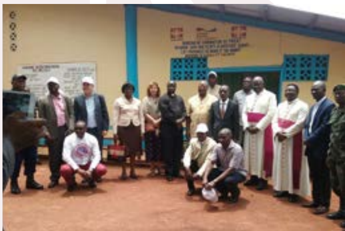
Une délégation de la Caritas Allemagne a été présente au lancement du projet « Un monde sans faim » à Gemena

La mobilisation au niveau du réseau Caritas Internationalis a connu une régression en 2018. Si le nombre de ces contributeurs du Réseau n'a pas baissé, les contributions de la Caritas Allemagne et de Caritas Norvège sortent du lot avec respectivement $1 452 286,11 et $784 118,89, tandis que celles de la Caritas International Belgique et de CAFOD ont quasiment triplé.