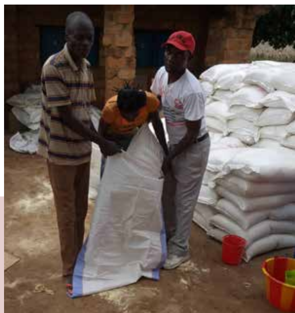
Des vivres, outils aratoires et semences maraichères ont été remis à 2.337 ménages à Luiza

Rappelons que depuis août 2016, les provinces du Kasai ont été fortement touchées par une crise humanitaire générée par un conflit coutumier dans le territoire de Dibaya. Ce conflit, au départ causé par un mécontentement communautaire, a conduit à l'assassinat du chef coutumier KAMUINA NSAPU jusqu'à prendre des ampleurs incontrôlées. OCHA RDC rapporte également la présence de nouveaux déplacés internes ayant plongé ainsi plusieurs familles dans une situation de détresse, des pertes en vies humaines, des destructions massives d'habitations, des incendies d'écoles et infrastructures communautaires de base, avec un impact humanitaire significatif pour les personnes déplacées en termes de denrées alimentaires, d'accès à l'eau potable et aux articles ménagers essentiels,