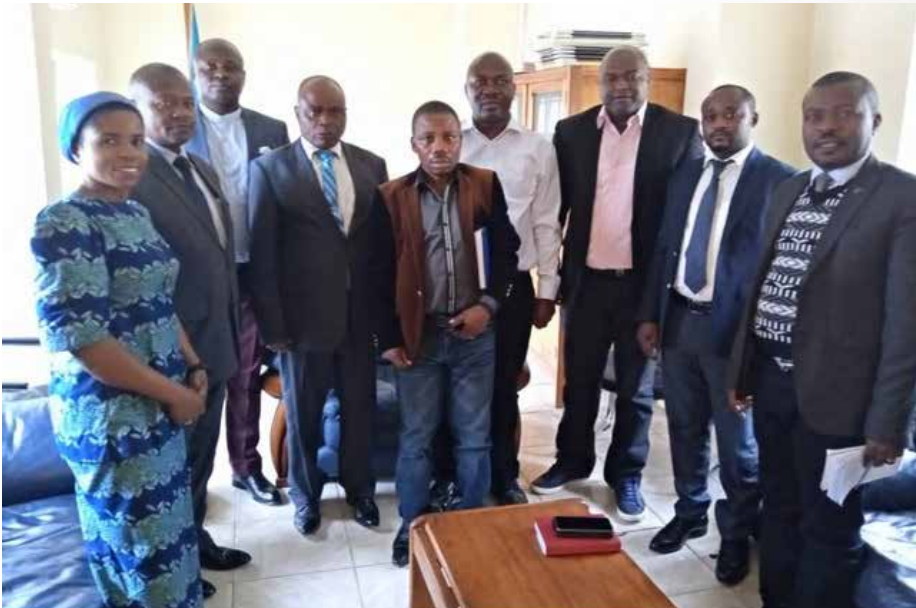
La délégation de la BLP et CEJP de la CENCO posant avec leurs interlocuteurs du Sud-Kivu

B ukavu, le chef-lieu de la Province du Sud-Kivu, a abrité récemment l'atelier d'information et de sensibilisation des Députés provinciaux et des Acteurs majeurs de la Société Civile du Sud-Kivu sur la Taxation du Tabac. Cet atelier s'est tenu jeudi 25 avril 2019 en présence d'éminentes personnalités. Il s'agit notamment du Vice-président de l'Assemblée Provinciale, également Bâtonnier de l'Ordre des Avocats du Sud-Kivu, accompagné de son Rapporteur et de 7 Députés provinciaux ; du Président de la Société Civile du Sud-Kivu et de principaux leaders des OSC (Organisations de la Société Civile) de Bukavu, de la Commission Diocésaine Justice et Paix (Archidiocèse de Bukavu), de la CLPP/Sud-Kivu. Cette activité cadre avec la mission du Bureau de Liaison avec le Parlement (BLP), une structure de la Conférence Episcopale Nationale du Congo (CENCO).