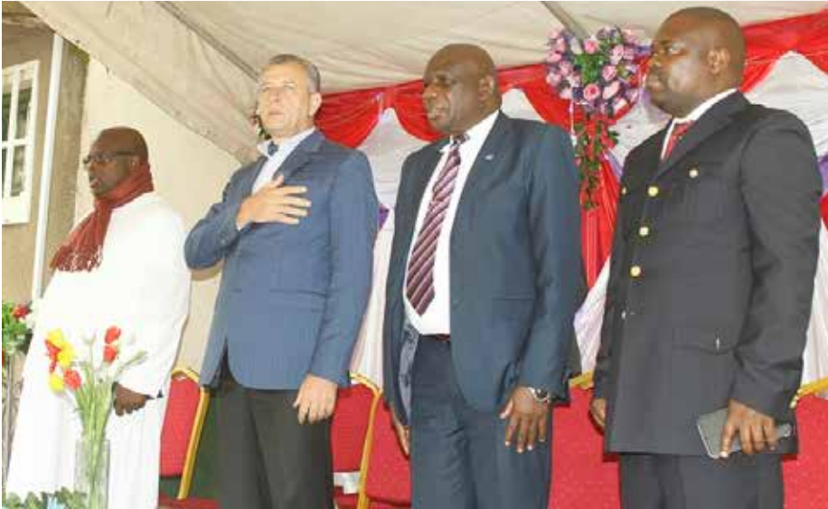
Le Directeur de la Caritas-Développement Bunia (à g.) aux côtés du Gouverneur de l'Ituri et d'autres Officiels