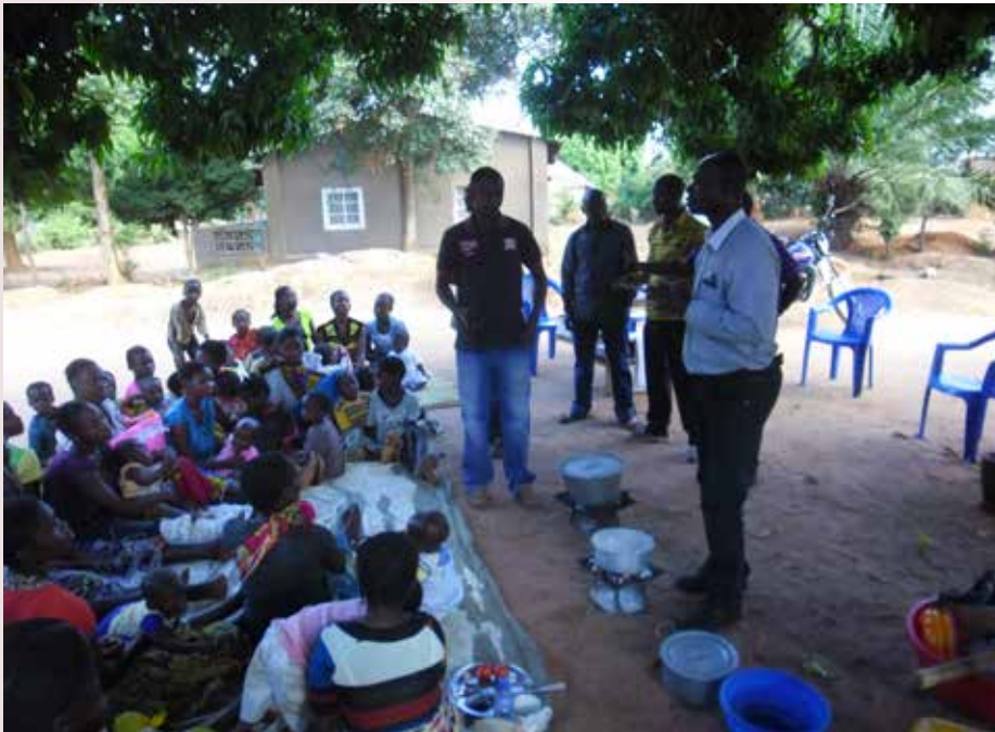
Les enfants de 0 - 11 mois et les femmes enceintes, cibles du projet

« Renforcer la demande pour la vaccination à travers la redynamisation effective des organes des participations communautaires existant », tel est l'objectif du projet GAVI/OSC RSS2, exécuté par la Caritas Congo Asbl.