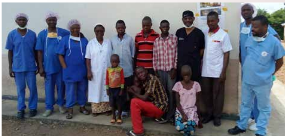
L'équipe d'intervention de fentes labiales et palatines posant avec les opérés

Et cela, après une sensibilisation dans les 5 Zones de Santé (Mbulula, Kongolo, Kabalo, Kitenge et Kabongo), 18 paroisses qui couvrent la population diocésaine de Kongolo. Du 30 mars au 1 er avril 2019, la prise en charge globale des personnes vivant avec fentes labiales et palatines a été réalisée dans la polyclinique Notre Dame de Miséricorde. Elle a concerné 11 enfants de 7 mois à 5 ans et 5 adultes de 24 à 65 ans. La durée de séjour était de 3 à 5 jours. Un repas liquide approprié fut disponibilisé pour leur nutrition.