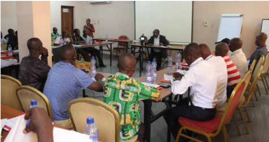
Le Président de la LINAPICO s'adressant aux participants à la 8 ème Session du CPN

La huitième session du Comité de Pilotage National (CPN) qui s'est tenue du 19 au 20 mars 2019 au Centre d'Accueil Caritas à Kinshasa a été une occasion d'évaluer les progrès réalisés par le projet et de trouver des pistes des solutions possibles en vue d'améliorer sa mise en œuvre. Les délégués des territoires cibles du PACDF ont été satisfaits sond'avancement.