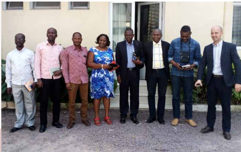
Photo de famille avec des partenaires à l'étape de l'élaboration du projet

A près le Haut-Katanga et le Haut-Lomami, Caritas Congo Asbl vient de s'engager dans le renforcement de la Surveillance à Base Communautaire (SBC) des cas de Paralyse Flasque Aiguë (PFA) et d'autres Maladies Evitables par la Vaccination (MEV) dans 5 Zones de Santé de l'Antenne PEV de Bumba. Une délégation conduite par son Secrétaire Exécutif a séjourné du 22 au 29 mars 2019 à Lolo et Bumba, dans la Province de la Mongala, pour appuyer le lancement officiel de la mise en œuvre des activités dudit projet.