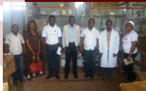
Lutte contre le VIH/Sida-Tuberculose et paludisme: Caritas Congo en évaluation des activités à Buta

Lutte contre le VIH/Sida-Tuberculose et Paludisme : une mission de Caritas Congo en évaluation des activités à Buta