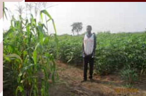
Un des paysans bénéficiaires du projet « Un Monde Sans Faim » dans le Sud-Ubangi

RDC : les résultats du diagnostic des approches de veille humanitaire et d'évaluation rapide multisectorielle validés à Kinshasa