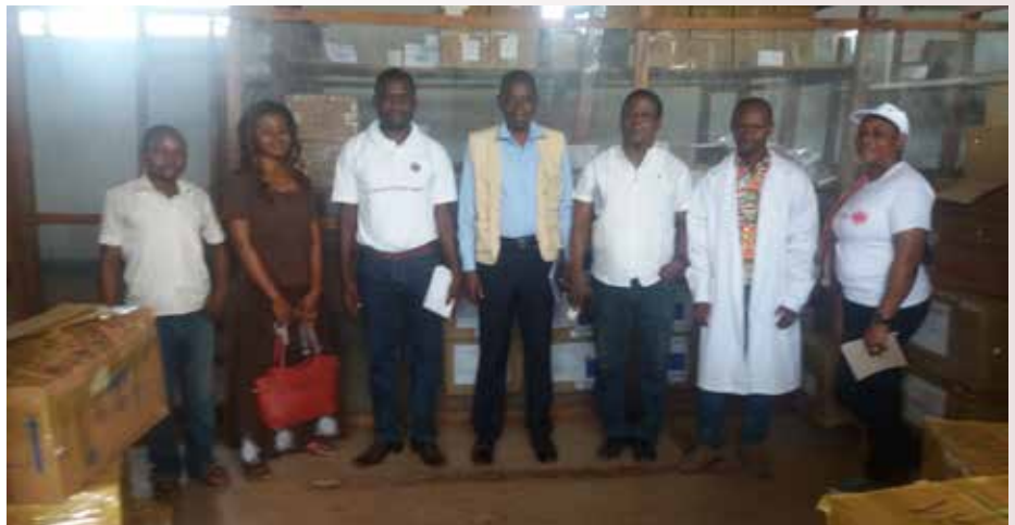
Des délégués de Caritas Congo et les partenaires de terrain à Buta

Caritas Congo Asbl vient d'effectuer une mission de suivi de la qualité de la mise en œuvre des activités du Programme de lutte contre le VIH /Sida-Tuberculose et le Paludisme du Nouveau Modèle de Financement 2 (NMF2), financé par le Fonds Mondial de lutte contre ces trois maladies (FM) dans la Province du Bas-Uélé, précisément à Buta. Elle s'est déroulée du 08 au 16 juin 2019.