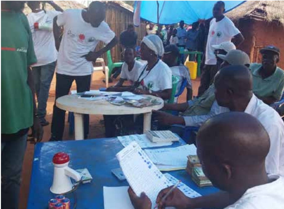
Ambiance lors de l'opération de remise de Cash Transfert aux ménages expulsés de l'Angola et familles d'accueil

C aritas Congo Asbl, en collaboration avec Caritas Luebo, ont remis une aide d'urgence en espèces (Cash) en Francs congolais à 2.312 ménages expulsés de l'Angola et familles d'accueil. Chaque ménage a reçu une assistance variant entre 94 et 55 dollars américains, selon sa taille. Ce projet a été financé par Last Days Saint Charities (LDS), à travers Catholic Relief Service (CRS- la Caritas des USA) qui participe à son accompagnement technique aux côtés de Caritas Congo Asbl.