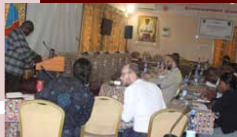
Des acteurs humanitaires en atelier de validation des résultats du diagnostic des approches de veille humanitaire

Equateur: Caritas et ses partenaires poursuivent la sensibilisation communautaire en faveur de la vaccination de routine