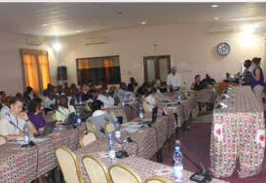
Vue partielle des participants à l'atelier national de présentation et de validation du diagnostic initial

Un atelier national de présentation et de validation du diagnostic initial sur les approches de veille humanitaire et d'évaluation rapide s'est tenu du mercredi 22 au jeudi 23 mai 2019 au centre d'accueil Caritas à Kinshasa/Gombe. Des acteurs humanitaires, experts techniques en matière de veille humanitaire et évaluation rapide multisectorielle ainsi que les représentants des mécanismes de réponse rapide y ont pris part pendant deux jours. Les représentants des projets sous financement du Fonds Humanitaire RD Congo, en matière de redevabilité (UNFPA/Save The Children) et inclusion (HI) ont participé aussi à ces assises. La participation de ces derniers a visé à assurer un lien de coordination stratégique et opérationnelle entre les projets Caritas Congo et ACTED, financés en 2018 par le Fonds Humanitaire en RDC, à travers son allocation.