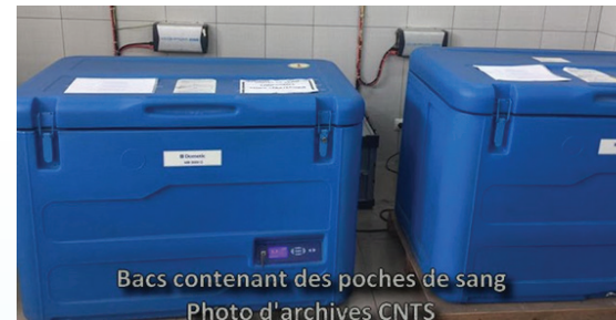
Bacs contenant des poches de sang

En plus des poches de sang, des médicaments ont aussi été envoyés pour améliorer la prise en charge médicale des blessés. Toutefois, la logistique reste un