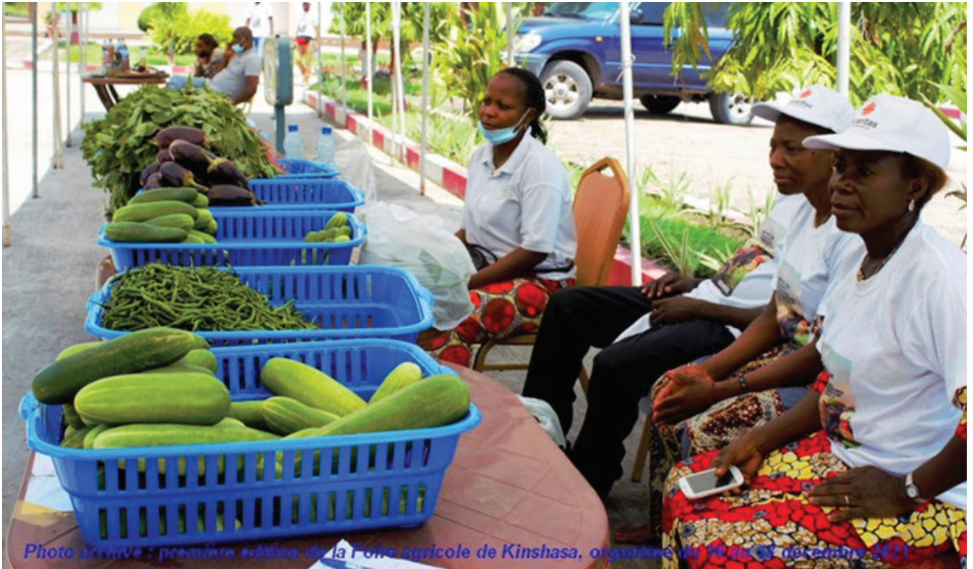
Photo archive : première édition de la Foire agricole de Kinshasa, organisée du 19 au 31 décembre 2021

C ontribuer dans les 3 zones du projet à l'autonomisation économique des femmes, principalement en appuyant des structures de l'écosystème entrepreneurial, à adapter leurs offres de services financiers et non financiers aux barrières structurelles rencontrées par les femmes entrepreneures, tel est l'objectif principal du projet "SUCCÈS POUR ELLES.