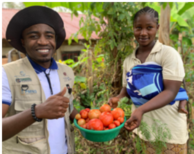
Récolte des tomates dans l'AS de Mbayo/ZS de Miti Murhesa