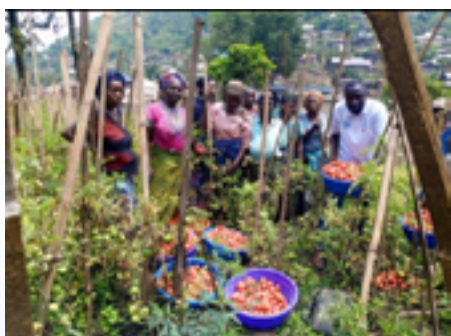
Récolte des tomates dans la CAC à Minova

Nous sommes des bénéficiaires du PMNS/NAC dans la Province du Sud Kivu. Il y a parmi nous une femme allaitante ayant 6 enfants. Nous habitons dans le village de Bideka de la Zone de Santé de