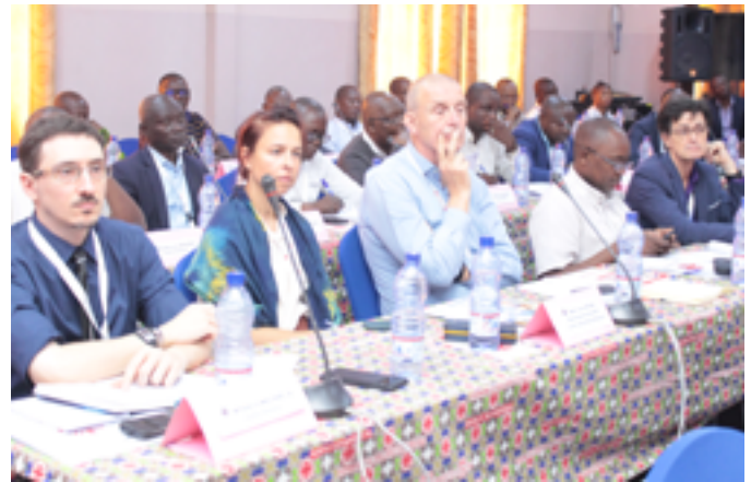
Des Représentants des Caritas Sœurs au 5ème Forum National du Réseau Caritas en RDC

Son Secrétariat Exécutif s'occupe de la coordination des activités de toutes les 48 Caritas Diocésaines, de la représentation de ces Structures, du renforcement de leurs capacités, du plaidoyer au profit des plus démunis, ainsi que de la mobilisation des ressources et de la promotion d'un partenariat responsable.