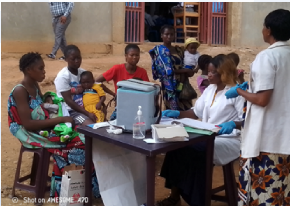
Séance de récupération des enfants incomplètement vaccinés à Boma-Bungu

durée de 12 mois (mai 2024 à avril 2025) appuie 8 Zones de Santé (Matadi, Nzanza, Nsonampangu, Inga, Boma, Boma Bungu, Moanda et Kitona) de la Province du Kongo Central avec la collaboration des Diocèses de Matadi et de Boma.