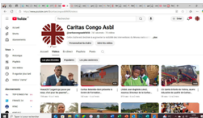
Vue partielle de la chaîne YouTube de la Caritas Congo Asbl

Par devoir de redevabilité, Caritas Congo Asbl a veillé à rendre compte de manière professionnelle de l'utilisation des ressources qu'elles a mobilisées au profit des populations congolaises en 2024. Elle a recouru à ses canaux de communication ci-dessous. Ces canaux ont aussi permis la visibilité des interventions du Réseau national de Caritas en RDC, augmentant ainsi sa crédibilité et la mobilisation des ressources par cette lisibilité de leur impact auprès des communautés vulnérables et vivant dans la pauvreté.