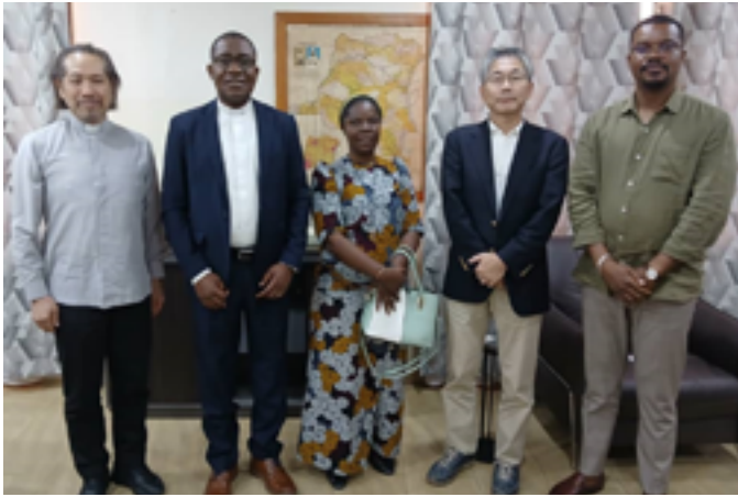
A l'extrême gauche, les deux Secrétaires Exécutifs de Caritas Japon et Caritas Congo Asbl et leurs Collaborateurs