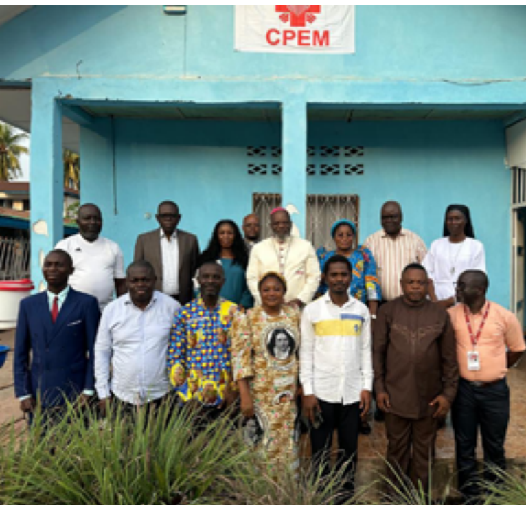
Photo de famille après la clôture de la rencontre provinciale des Directeurs des BDOM par Mgr l'Archevêque de Mbandaka

Dans la suite de ce rapport sont décrits les différents programmes et projets qui ont permis à Caritas Congo Asbl de contribuer à la mise en œuvre du Plan National du Développement Sanitaire de la RDC au cours de l'année 2024.