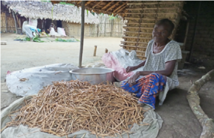
Une femme bénéficiaire et sa récolte de Soja à Kailo, village de Bueni 2 (Maniema)

Le reboisement des espaces dégradés ont eu lieu dans la période de janvier à mars 2024 dans les villages de Cifunzi, Fendula, Caminunu et Bumoga dans le groupement de Kalonge.