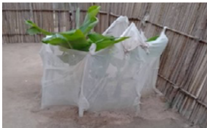
Mauvaise utilisation des MILD au Sankuru

6 Provinces, à savoir Ituri, Kongo Central, Kwilu, Sankuru, Équateur et Tanganyika. Au total, le suivi post-distribution effectué par Caritas Congo Asbl a touché directement 6 525 856 ménages des 6 Provinces citées ci-haut. Et respectivement, ce sont les BDOM des Diocèses de Bunia, Mahagi-Nioka, Matadi, Boma, Kisantu, Kikwit, Kenge, Idiofa, Tshumbe, Mbandaka-Bikoro, Kalemie-Kirungu et Kongolo qui ont appuyé de façon opérationnelle les enquêtes des PDM.