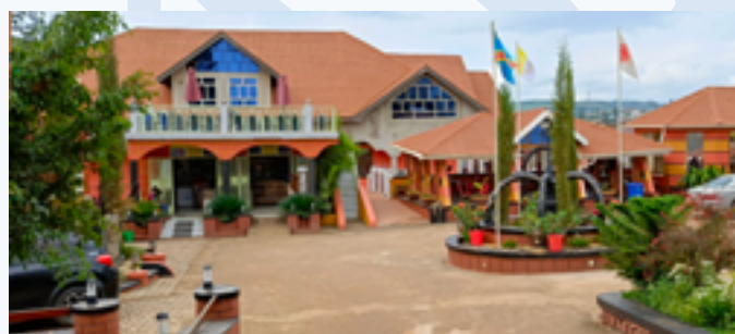
Vue partielle du Centre d'accueil de la Caritas Mahagi-Nioka