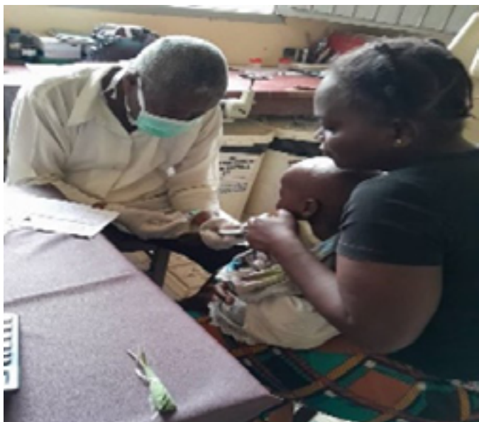
Dépistage des enfants suspects dans les établissements des soins de Santé

Les résultats ci-dessous reflètent l'appui de Caritas Congo Asbl en 2024 :