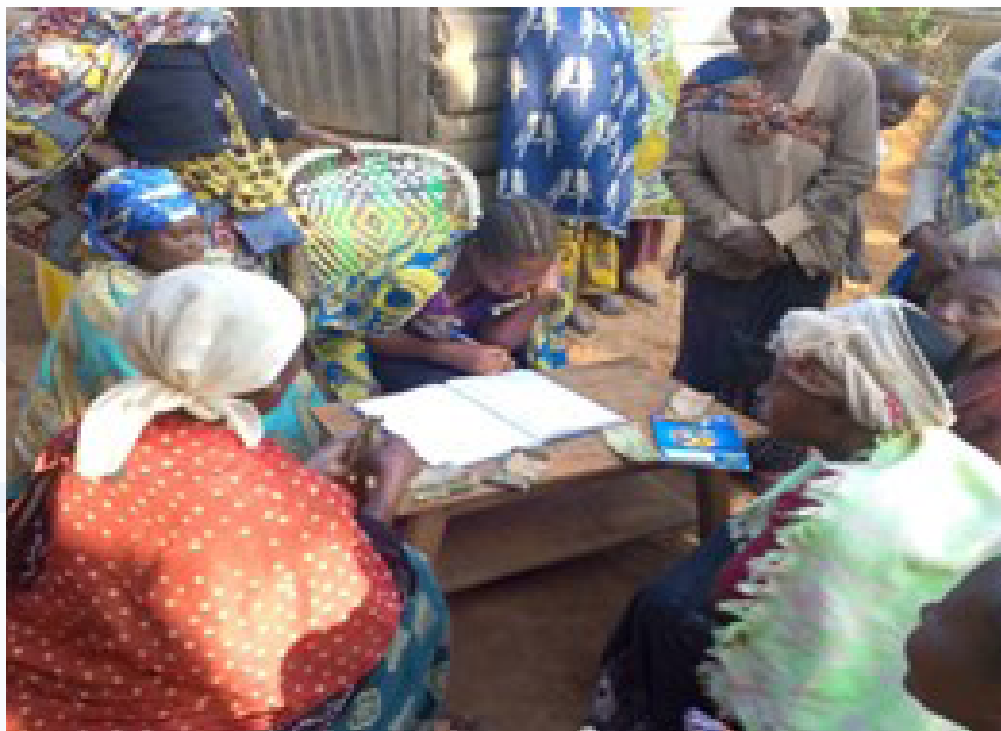
Partage des intérêts par les membres des AVEC

Le bilan des formations et activités réalisées au cours de l'année 2024 se présente de la manière suivante :