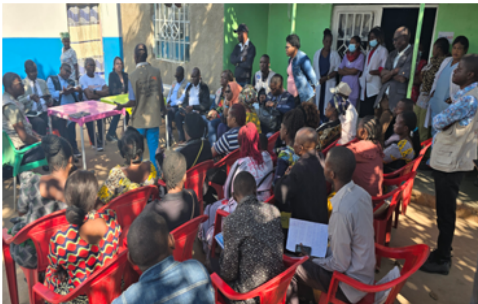
Supervision conjointe BMGF, PATH, OMS, UNICEF, Caritas Congo Asbl, DPS Lualaba, dans l'Aire de Santé Kizito/ZS Manika pour échanger avec les acteurs communautaires du projet.

Le projet cible les enfants de 0 à 15 ans (1 531 443) et les femmes enceintes de toute la province directement et indirectement toute la population du Lualaba en général soit 3 235 824 habitants. Selon les axes stratégiques du projet, voici ci-dessous les résultats obtenus de mars 2023 à décembre 2024, le projet lui-même ayant une durée de 12 mois :