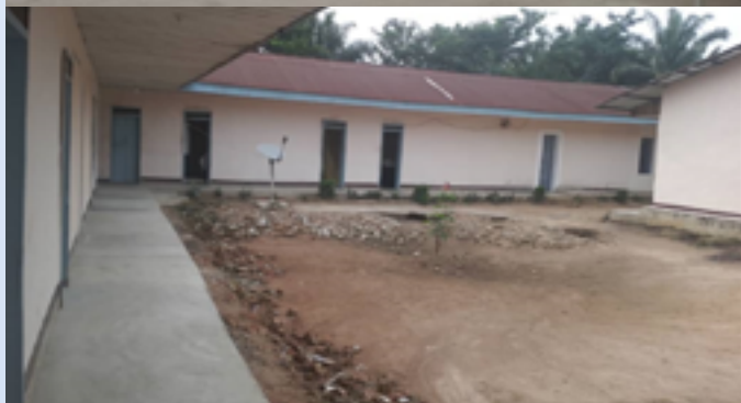
Bureau de la Caritas-Développement Tshumbe (en vue partielle)

(Identité Caritas, Partenariat, Renforcement des capacités, Mobilisation des ressources, Redevabilité, Capitalisation des expériences) ;