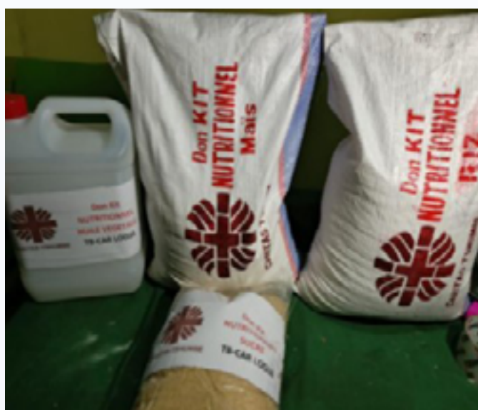
Kit pour le soutien alimentaire des tuberculeux en milieu carcéral de la Prison centrale de Lodja

Dans le cadre du financement du Fonds Mondial qui appuie la République Démocratique du Congo (RDC) dans la lutte contre le paludisme, le VIH et la Tuberculose, Caritas Congo Asbl a été Sous-Récepteur de CORDAID dans les provinces du Sankuru, Tanganyika et Bas-Uélé. En effet, cette subvention devait prendre fin en juin 2024, mais a bénéficié d'une extension jusqu'en octobre de la même année. Cette subvention a été mise en œuvre dans toutes les 38 Zones de Santé (11 ZS au Bas-Uélé, 11 ZS dans le Tanganyika et Sankuru avec 16 ZS) que comptent les trois provinces et avec la collaboration des Diocèses de Buta, Tshumbe et Kalemie-Kirungu.