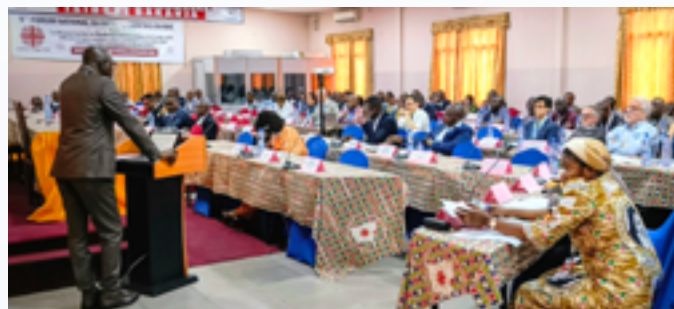
Il y avait plus de 100 participants au 5ème Forum National du Réseau Caritas en RDC, dont les Directeurs/Coordonnateurs de toutes les 48 Caritas-Développement et de 2 Caritas provinciales, ainsi que des Représentants des Caritas Sœurs de l'Occident.

4. Contribuer à la consolidation de la bonne gouvernance et de la transparence dans la gestion des affaires publiques (implication du Réseau Caritas dans la mise en œuvre et le suivi des ODD (Agenda 2030) en rapport avec les engagements du Gouvernement congolais; Formation des animateurs de la Société Civile et des élus locaux au contrôle citoyen de l'action publique; publication, à travers les médias, des rapports de contrôle citoyen de l'action publique; etc).