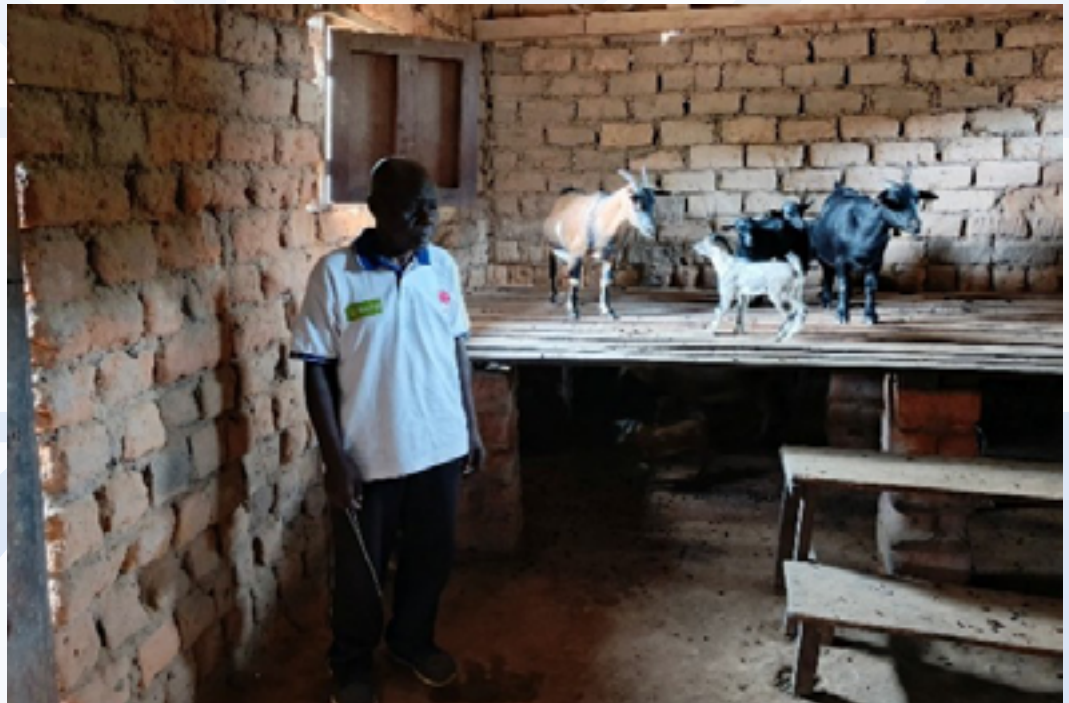
Centre de reproduction installé en 2024 dans un des axes de Kasongo dans le diocèse de Kindu