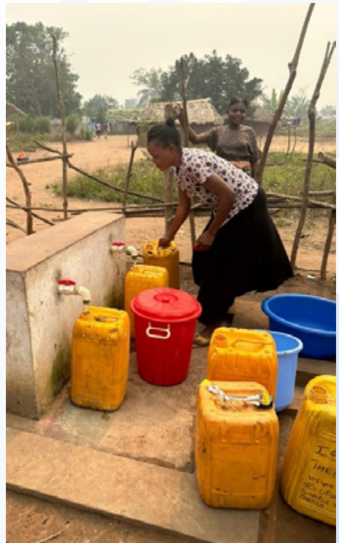
Forage d'eau à Muila-Dominique

La collecte des données s'est déroulée du 24 juillet au 07 août 2024 et a été facilitée par la participation de 10 enquêteurs. Au total, 185 bénéficiaires du PASA – NK ont été touchés. En revanche, 154 anciens bénéficiaires des projets RePAC 1 et 2 ont été concernés par cette mission.