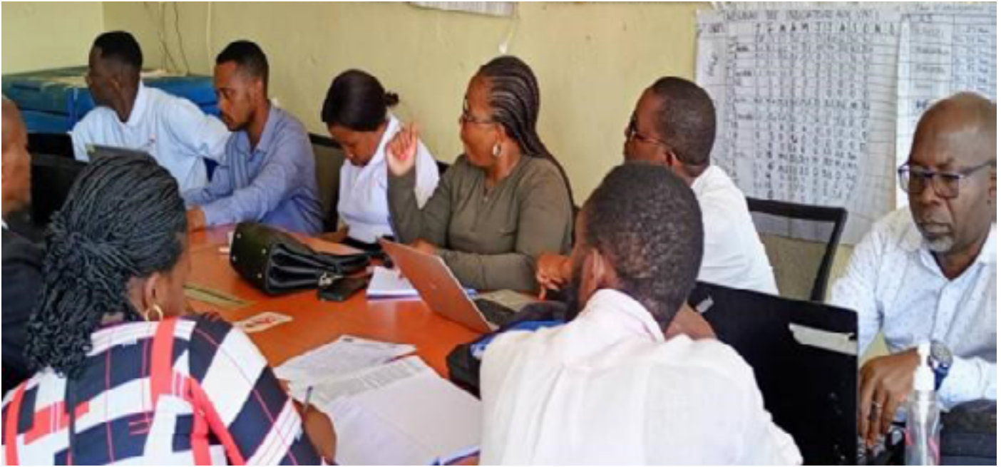
Etat des lieux dans la Zone de Santé de Nyantende