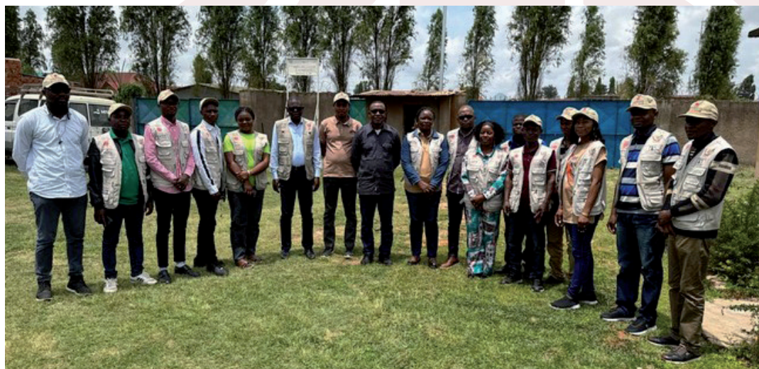
Le Secrétaire Exécutif de Caritas Congo Asbl et le Coordonnateur National de la Santé auprès de Caritas-Développement Kolwezi

Ces cinq rôles doivent aussi être joués par les Caritas diocésaines envers les Caritas paroissiales. A ces dernières, il est ajouté un sixième : l'exécution des projets.