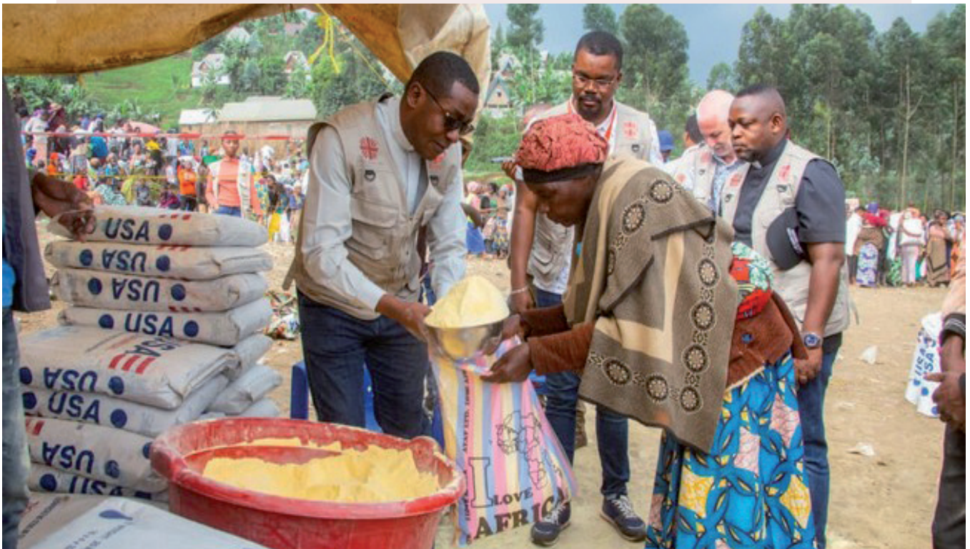
Distribution de l'aide de Caritas à 1300 ménages retournés de Katembe et Malehe dans le Diocèse de Goma

1300 ménages retournés de Katembe et Malehe dans le diocèse de Goma ont reçu des vivres. Chaque ménage a reçu : 25kg de farine de maïs, 25kg de riz, 20kg des haricots, 5 litres d'huile et 1 kg de sel iodé. Il est à noter que le paquet distribué à chaque ménage constitue une ration standard de taille 5 pour une période de 30 jours.