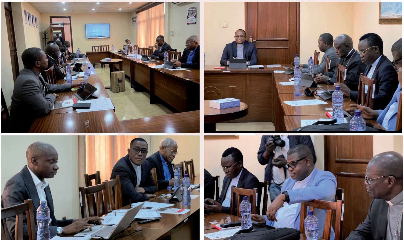
Le Conseil d'Administration de la Caritas Congo Asbl en sa 28 e Session ordinaire, du vendredi 05 au samedi 06 décembre 2025, dans la salle Abbé Jean Muela du Centre d'accueil Caritas à Kinshasa/Gombe.

Commentaire : Caritas Congo Asbl a poursuivi sa mission avec détermination. En 2025, nous avons mobilisé 11.041.305,58 USD, qui ont permis de servir directement 3.041.743 personnes. Les uns ont été soignés, assistés ou formés ; les autres ont vu leurs capacités productives, managériales ou de contrôle augmenter, avec un impact direct sur les revenus de leurs ménages et communautés respectifs. Parmi les 3.041.743 bénéficiaires, il faudrait retenir que 2.511.172 personnes ont été servies à travers les Projets de Nutrition, Santé maternelle et infantile, lutte contre le Paludisme et la Vaccination.