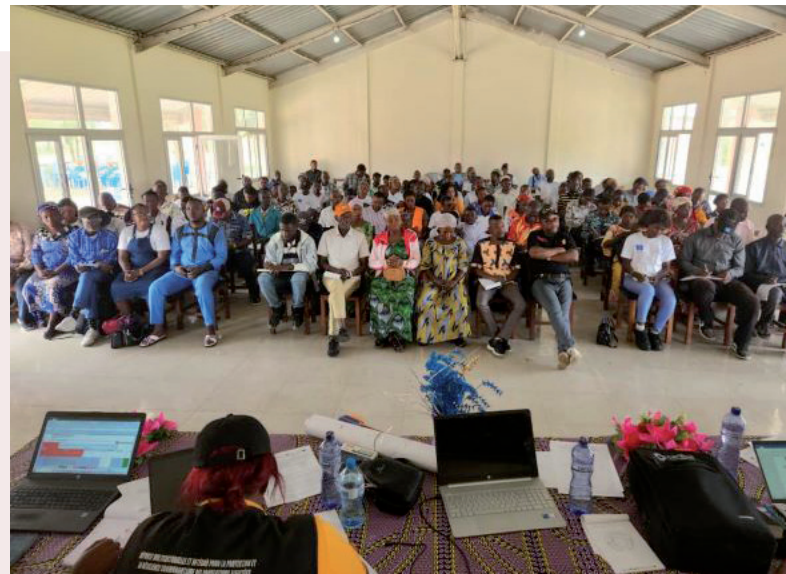
Mise en Réseau des agents communautaires du projet LISANGA et collecte des avis des communautés

tous les agents communautaires y compris les autorités locales