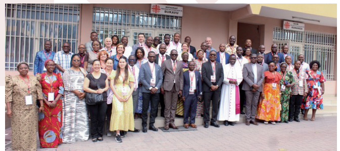
Participants à la Table Ronde de Caritas Congo Asbl

Après avoir échangé sur les défis, les enjeux et les opportunités, ils se sont engagés à renforcer la résilience des Organisations Caritas et l'efficacité de leurs interventions dans les domaines de réponses aux catastrophes, du développement durable, de la santé et du plaidoyer en République Démocratique du Congo.