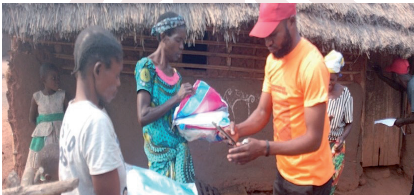
Prélèvement du QR code sur la moustiquaire par un agent de suivi dans la zone de santé de de Masimanimba de la Province du Kwilu.

Ce sont les Provinces du Nord-Kivu, Tshuapa, Équateur, Maniema et Kwango qui ont ciblées au cours de l'année 2025 mais les campagnes n'ont pas encore eu lieu au Nord Kivu pour des raisons sécuritaires et à cause de plusieurs reports du calendrier au Maniema, et pourtant les acteurs de suivi ont déjà été formés par Caritas Congo Asbl. Aussi, les résultats de suivi des campagnes, lancées en décembre 2025 dans les Provinces de l'Équateur et de la Tshuapa, ne sont pas encore disponibles, car finalement elles sont en cours d'exécution et seront achevées au mois de janvier 2026.