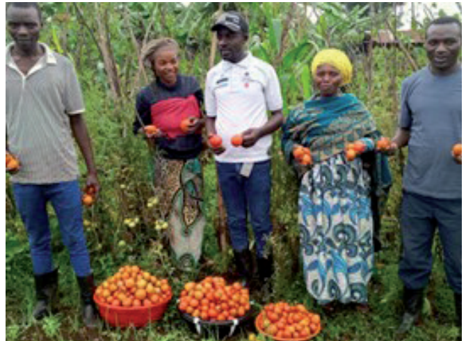
Tomates récoltées par les ménages après avoir reçu les semences.

Depuis le mois de décembre 2024, Caritas Congo Asbl a été retenue, par la Direction de Développement et de la Coopération « DDC » en sigle, en vue de piloter le Programme Santé Maternelle et Infantile (PSaMI) dans 10 Zones de Santé sur les 34 que compte la Province du Sud-Kivu aux côtés d'autres partenaires d'exécution. Et ce, pour une durée de 4 ans. Les ZS ciblées sont Bunyakiri, Kaziba, Kalehe, Minova, Mubumbano, Mwana, Nyangezi, Nyantende, Uvira et Ruzizi. Les objectifs ultimes de ce programme sont entre autres l'amélioration de l'accès aux services de