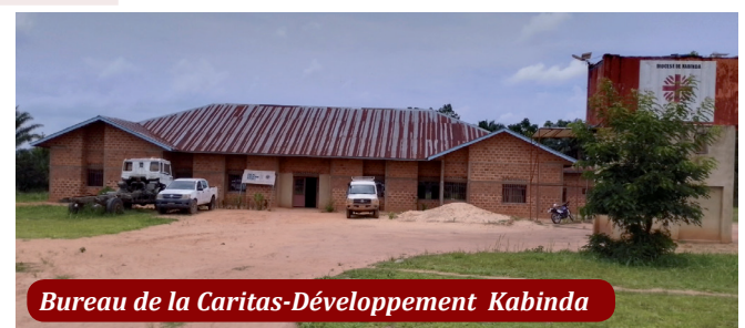
Bureau de la Caritas-Développement Kabinda