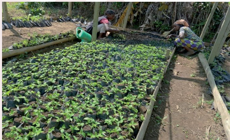
Dispositif pour le reboisement pépinières des plantules dans le territoire de Lubero

sions des AVEC dont 53 femmes, ont été capacités sur la gestion de cette approche SILC et AVEC.