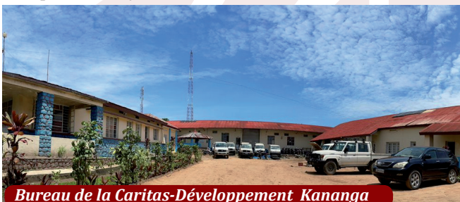
Bureau de la Caritas-Développement Kananga

4. Accompagner les dynamiques d'autonomisation et d'engagement civique des communautés locales basées sur leurs atouts (implication du Réseau Caritas dans la mise en œuvre et le suivi des ODD (Agenda 2030) en rapport avec les engagements du Gouvernement congolais; Formation des animateurs de la Société Civile et des élus locaux au contrôle citoyen de l'action publique; publication, à travers les médias, des rapports de contrôle citoyen de l'action publique; etc).