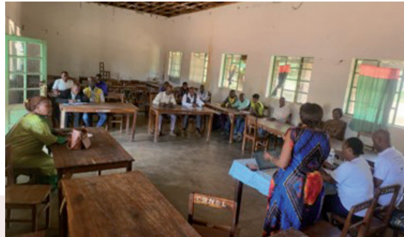
KILWA : Point focal de CONAPAC Grand KATANGA, en plein renforcement des représentants des OSC, Services Etatiques et Autorités locales, sur le foncier et les outils de sécurisation foncière