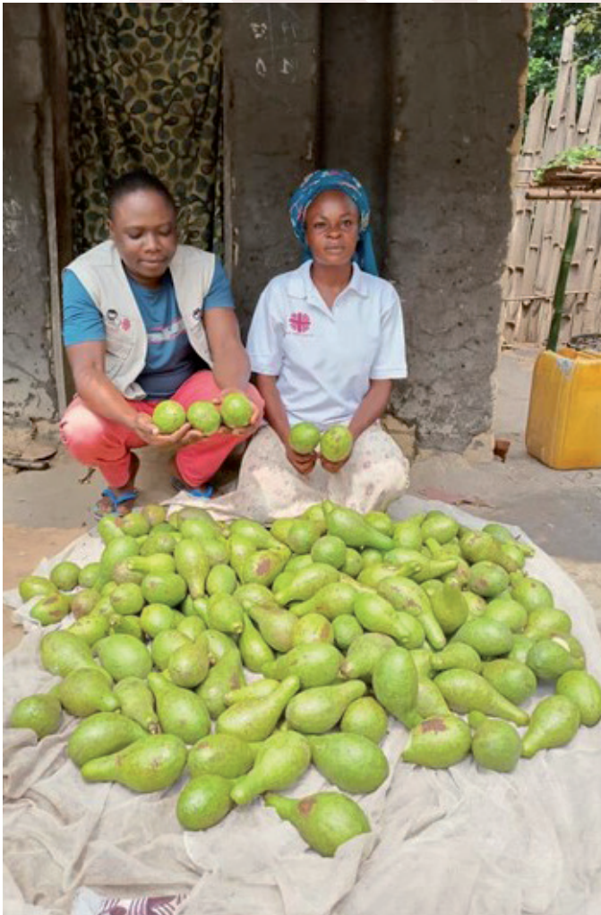
Récolte d'avocats à Kailo par une bénéficiaire du programme, village de Bueni 2 (Maniema).