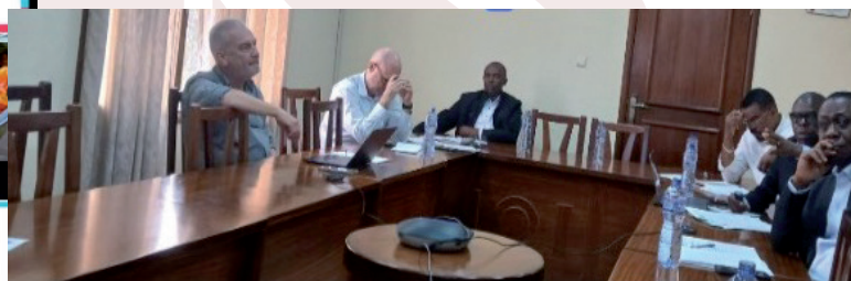
Vue partielle des participants à une réunion de Country-Forum en 2025