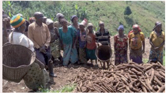
Récolte d'un champ pilote à Kalonge/Kalehe – Sud Kivu