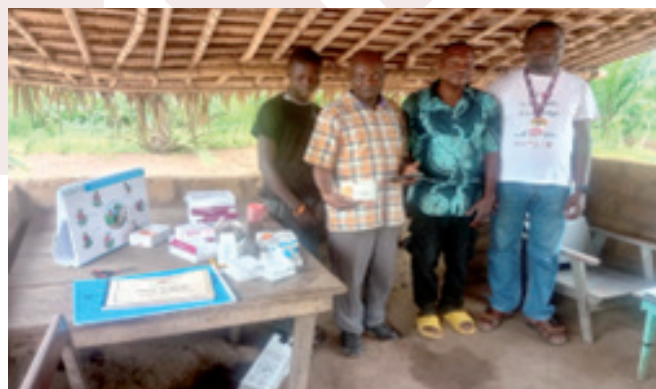
Visite au SSC de Donolongo, AS Gbanga, ZS Bili, Diocèse Molegbe

- 106.968 Moustiquaires Imprégnées d'Insecticide (MII) ont été distribuées à 110.456 femmes enceintes et enfants pendant les séances