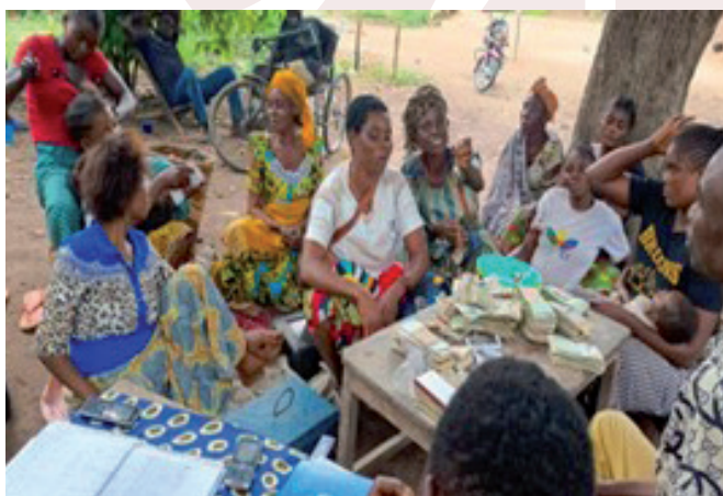
Partage fonds AVEC aux Membres de l'association « Tuepuke uvivu » à Malela

mations ont touché 347 ménages à Lubero, 399 pour Kasangulu, 208 à Kasongo et 460 à Kongolo.