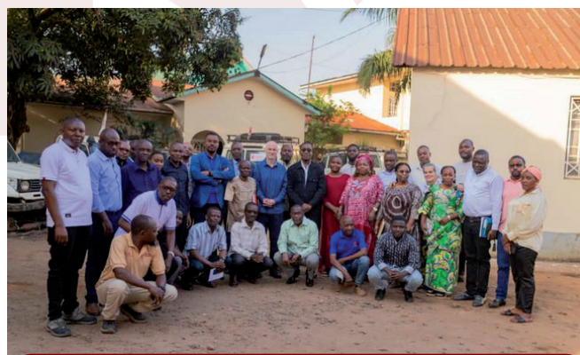
Visite de solidarité de Caritas Internationalis et Caritas Congo Asbl auprès de la Caritas-Développement Bukavu

Au niveau du continent, Caritas Congo Asbl fait partie de 46 Organisations nationales formant Caritas Africa qui comprend 6 Zones. Au niveau sous-régional, elle est l'une de trois Caritas de la Zone ACEAC (Association des Conférences Episcopales d'Afrique Centrale) avec Caritas Burundi et Caritas Rwanda.