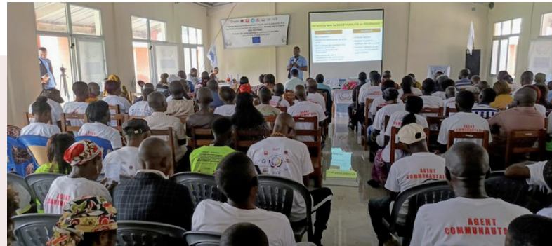
D'importants résultats et des défis du projet LISANGA échangés avec les communautés au Forum de redevabilité et cohésion sociale de Mbankana

- Sans faire du proxénétisme, l'exécution des projets sur le terrain dans différents diocèses a permis au grand public de comprendre l'identité