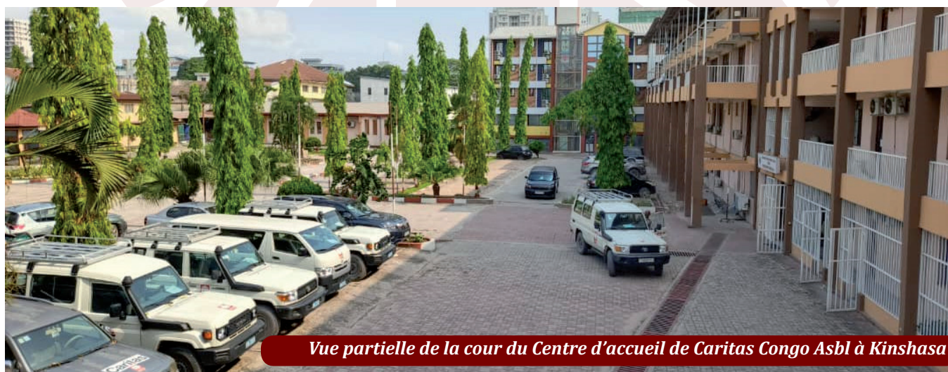
Vue partielle de la cour du Centre d'accueil de Caritas Congo Asbl à Kinshasa