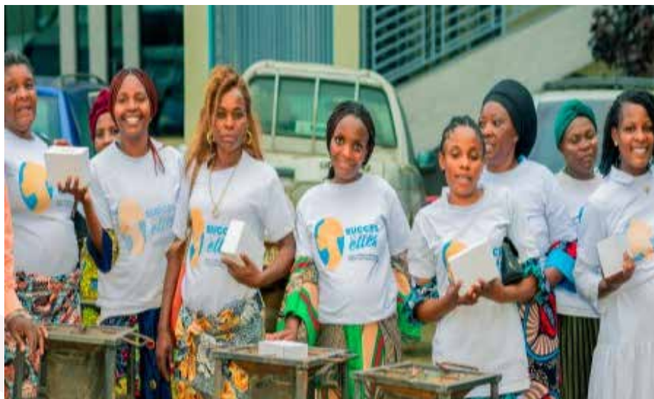
Des bénéficiaires de « SUCCÈS POUR ELLES »

Ces résultats témoignent de l'impact concret du projet sur l'autonomisation des