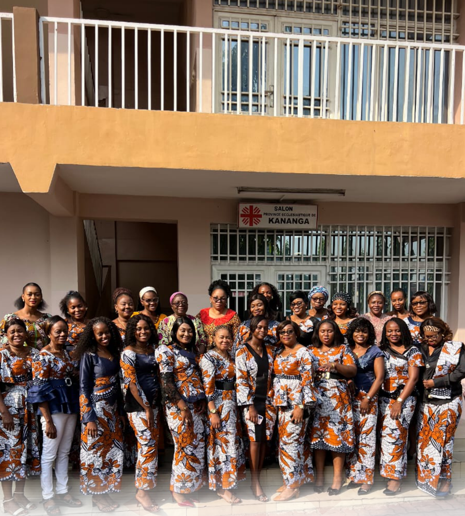
Les Femmes Travailleuses de la Caritas Congo Asbl clôturant le mois de mars 2026