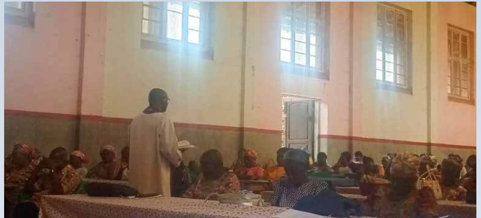
Récollecion de la CDMB avec ses Caritas paroissiales

Les enseignements ont porté sur la vision de la CDMB : bâtir une société solidaire et responsable, capable de se prendre en charge. Les participants ont été sensibilisés à l'importance de l'autonomie des paroisses et doyennés, malgré les défis économiques et logistiques rencontrés. Parmi les intervenants, figuraient le Directeur a.i du BDC, le Chargé de programme du même