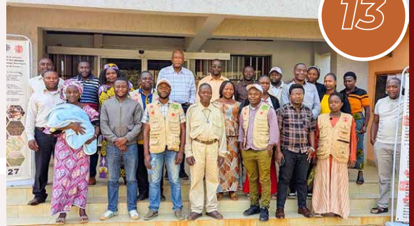
La Caritas-Développement Butembo-Beni renforce sa gouvernance à travers un atelier sur les Normes de Gestion de Caritas Internationalis