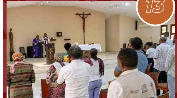
Le Personnel de Caritas Congo Asbl lors d'une célébration eucharistique à sa chapelle