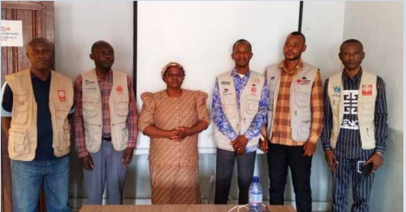
La Coordonnatrice de la CD Kananga posant avec certains de ses collaborateurs

La Caritas-Développement Kananga a organisé pendant six jours consécutifs la revue annuelle 2025 et la planification des activités pour l'année 2026. Ces travaux stratégiques se sont tenus dans la salle de réunion de l'institution, réunissant les principaux responsables de la structure. Réparties sur six jours, les rencontres ont alterné trois journées d'évaluation et trois journées de planification, offrant un cadre d'autoévaluation interne du plan d'action 2025, avant la projection vers les priorités de la nouvelle année 2026.