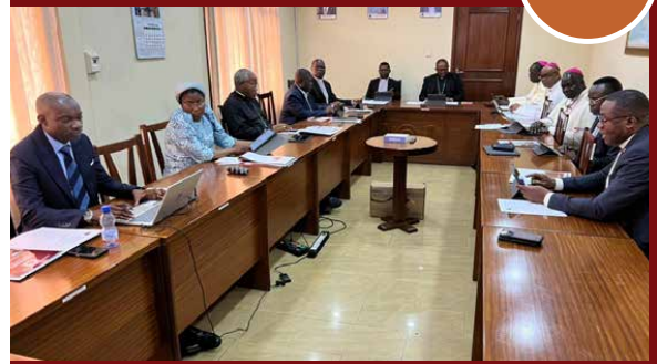
Le Conseil d'Administration de la Caritas Congo Asbl a validé son Rapport annuel 2025 lors de sa 29 ème session