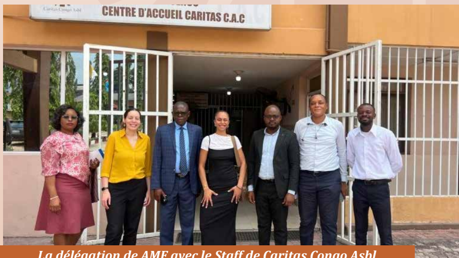
La délégation de AMF avec le Staff de Caritas Congo Asbl