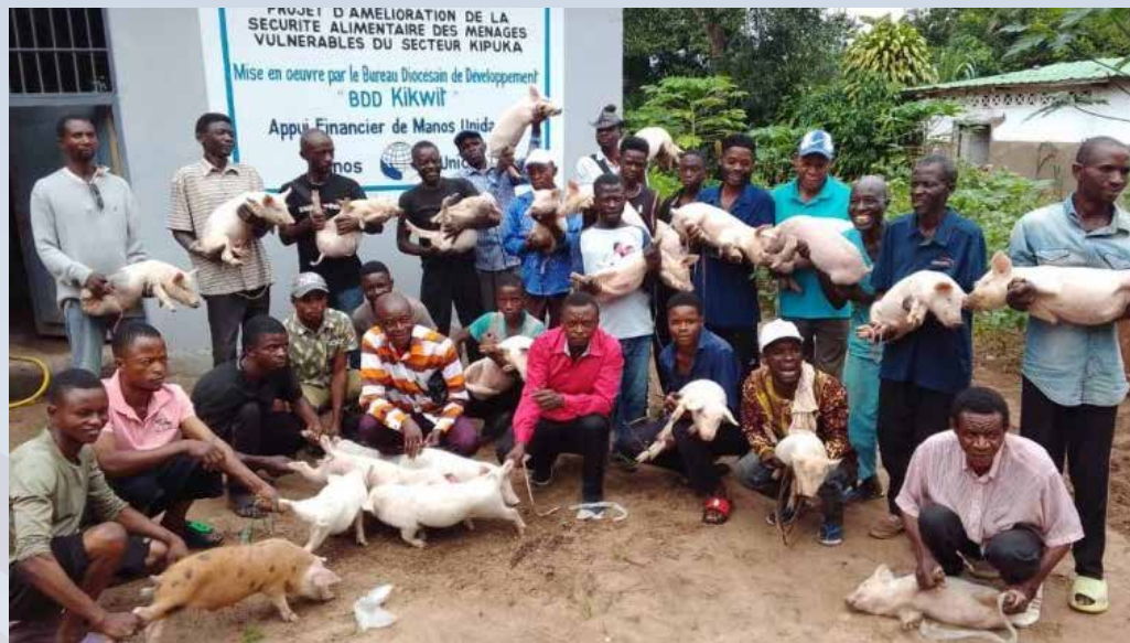
La joie immense des ménages recevant leurs porcelets

Après la distribution, un accompagnement de proximité est assuré par les animateurs