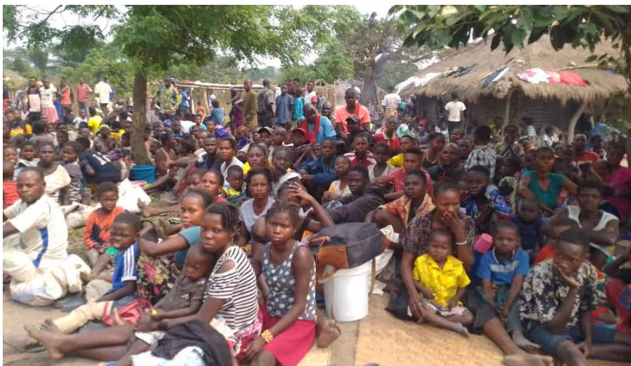
Des personnes déplacées en situation de détresse

L e Gouvernement congolais et ses partenaires ont officiellement lancé, mercredi 28 janvier à Kinshasa, le Plan de réponse humanitaire pour l'année 2026.