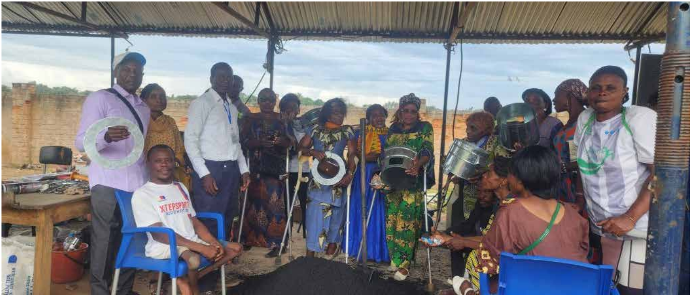
Ambiance joyeuse à la Caritas-Congo/Katanga

D ans le cadre du Projet d'Énergies Durables et Revenus Responsables, la Caritas-Congo/ Katanga Asbl franchit une nouvelle étape majeure. Forte de son expertise dans la production industrielle de charbon bio et de foyers améliorés, l'organisation a lancé ce lundi 02 Février 2026 un programme de formation innovant destiné aux personnes vivant avec handicap dans le but de leur transmettre un métier d'avenir et les intégrer pleinement dans l'économie locale.