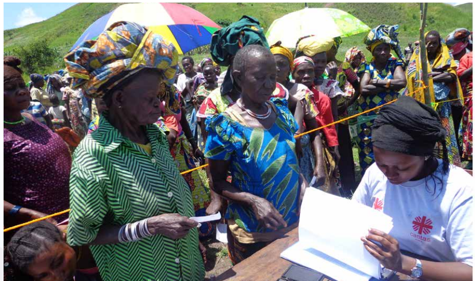
Enregistrement des déplacés par la Caritas Bunia

Le 13 février, des accrochages à Kiyeye ont causé