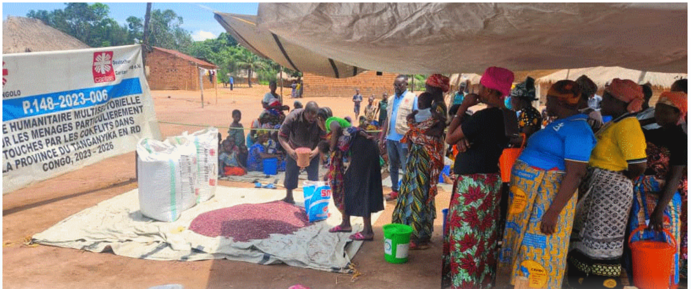
Des personnes déplacées recevant l'aide de la Caritas Kongolo

C aritas Développement Kongolo a procédé à la distribution des semences maraîchères et vivrières au bénéfice de 1143 ménages déplacés et familles d'accueil dans l'aire de santé de Ponda Zone de santé de Mbulula. Ces ménages qui ont tout abandonné fuyant le conflit armé dans le territoire voisin de Kabambare sont venus s'installer dans le site des déplacés à Ponda et d'autres ont été reçus dans les familles d'accueils à Ponda, Kagoya, Muhemba, Kapalay, bugana - Kitungwa et Kazingu. Ces ménages manquaient de tout et vivaient dans des conditions très précaires.