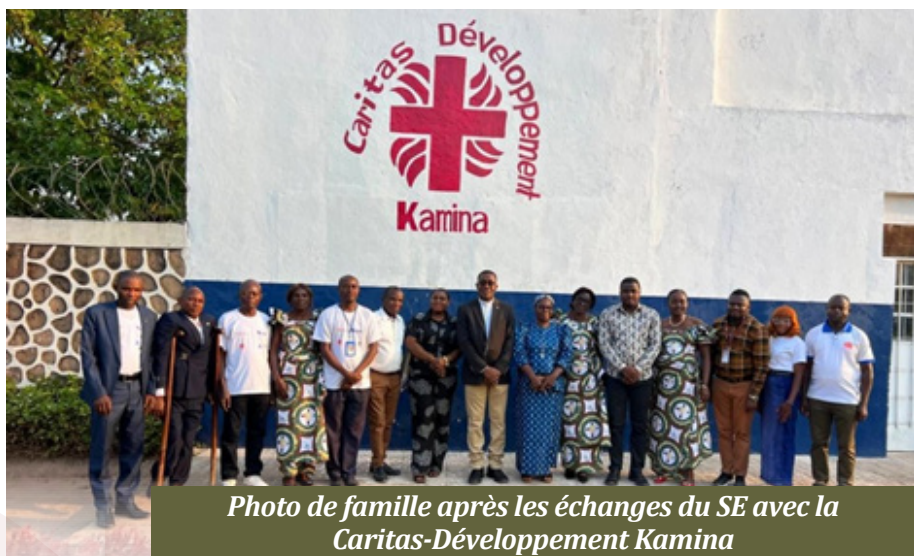
Photo de famille après les échanges du SE avec la Caritas-Développement Kamina

Le mardi 02 juin 2026, une visite guidée a permis à la délégation de découvrir les entrepôts de Caritas et les infrastructures scolaires récemment construites.