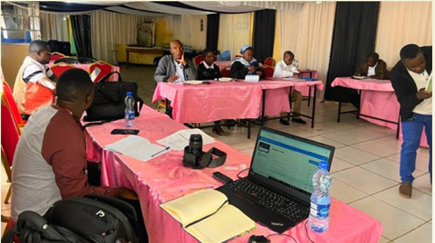
Echange du SE avec le personnel de la Caritas Sakania-Kipushi

La deuxième journée a été consacrée à la revue des recommandations issues des Normes de Gestion de Caritas Internationalis ainsi qu'à la présentation et à l'analyse des résultats de l'exercice SWOT.