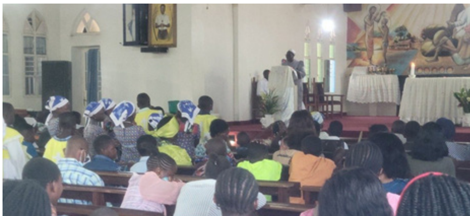
Récollecion de la CDMB avec ses Caritas paroissiales

Les principaux indicateurs de suivi de l'épidémie communiqués par le Ministère de la Santé Pu-