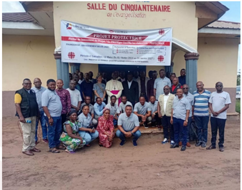
Vue des participants au lancement du projet PROTECTRICE

Pour Mgr Jean Pierre Kwambamba, Evêque de Kenge, « PROTECTRICE est une promesse, un